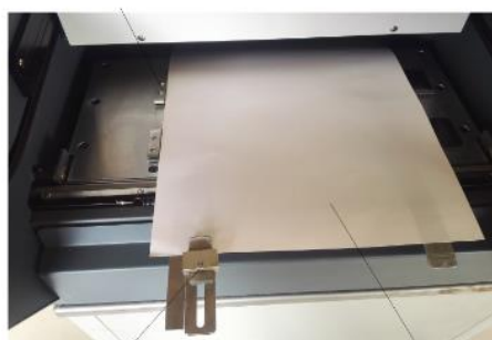
Регулятор положения обложки